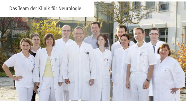
Das Team der Klinik für Neurologie

Die Klinik empfängt Patienten zur Diagnostik und Therapie des Morbus Parkinson und anderer Bewegungsstörungen.